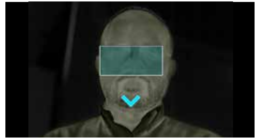
Automatischer Modus („Auto“)