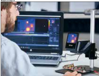
Stellen Sie über USB eine Verbindung mit einem Computer her und analysieren Sie Ihre Daten mit der FLIR Tools+ Software