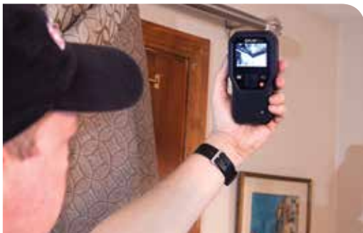
Das FLIR MR160 überprüft einen Decken-/Wandbereich auf Feuchtigkeitsprobleme