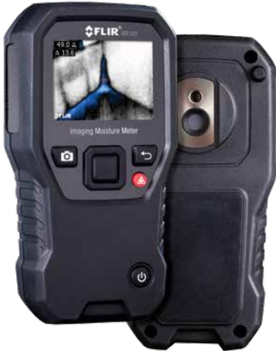
MR160 Feuchtemessgerät mit integrierter Wärmebildkamera

Das MR160 bietet einen integrierten Sensor für die nicht-invasive/berührungslose Messung und einen externen Kontaktsensor für die herkömmliche invasive Messung. Dadurch bietet es Ihnen die Flexibilität, sich von Fall zu Fall vor Ort für das passende Messverfahren zu entscheiden. Mit dem in der Baubranche einzigartigen MR160 bietet Ihnen FLIR ein revolutionäres Messgerät an. Als perfekte Ergänzung zu Ihrer hochauflösenden Wärmebildkamera, lässt sich das handliche Messgerät überall mit hinnehmen und beliebig einsetzen. Damit können Sie verborgene Feuchtigkeitsprobleme entdecken und noch effizienter zuverlässige, aussagekräftige Daten gewinnen.