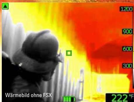
Wärmebild ohne FSX